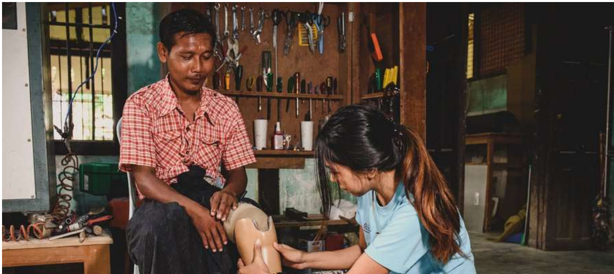
Een medewerker van TLM Myanmar werkt aan een beenprothese.

Het grote nieuws komt deze keer uit Myanmar ! U weet wellicht van de militaire coup, die volgde op democratische verkiezing van partijleider Aung Sang Suu Kyi (zij zit een straf van elf jaar uit). Door de politieke onrust en de pandemie is de gezondheidszorg van de overheid gestopt, of werd die heel slecht bereikbaar. Maar in Myanmar zijn er jaarlijks nog zo'n 2500 nieuwe gevallen van lepra; dit betreft vaak de allerarmsten. Nu is er een goede lokale private organisatie die deze mensen tóch nog kan bereiken, TLM Myanmar, dat protheses maakt. Wij zijn heel trots dat we samen met De Leprazending nu een project kunnen starten om 60 zeer kwetsbare mensen met een (lepra)handicap zo toch te kunnen helpen aan een beenprothese! Meer informatie volgt.