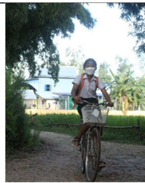
Snel naar school!