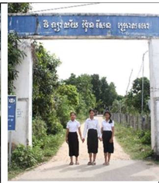
Bij school met vriendinnen