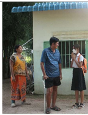
Afscheid van haar ouders