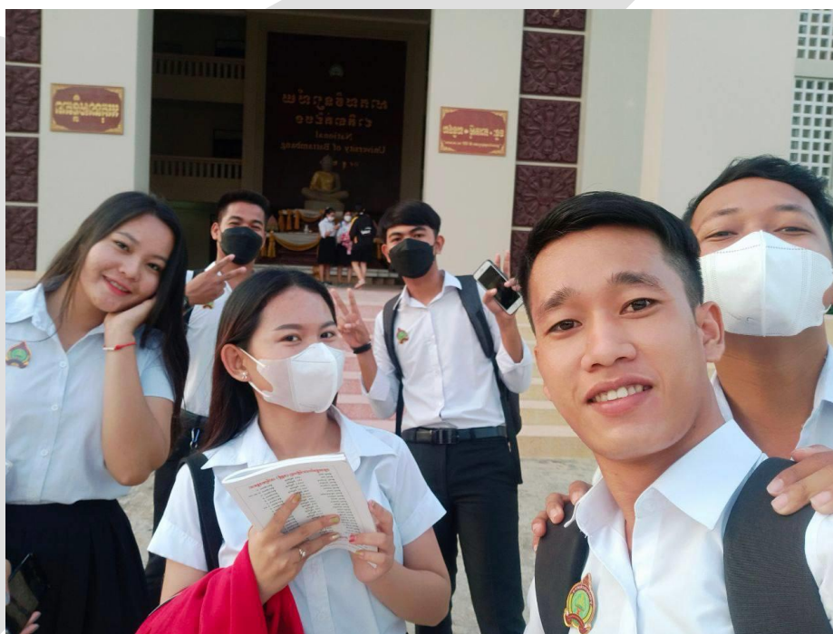
Studenten van de Heang Hong universiteit in Battambang

gevolgd op kosten van de stichting. Dat is van belang voor de communicatie met, en voor de rapportage ten behoeve van de verslaglegging aan, de PDS.