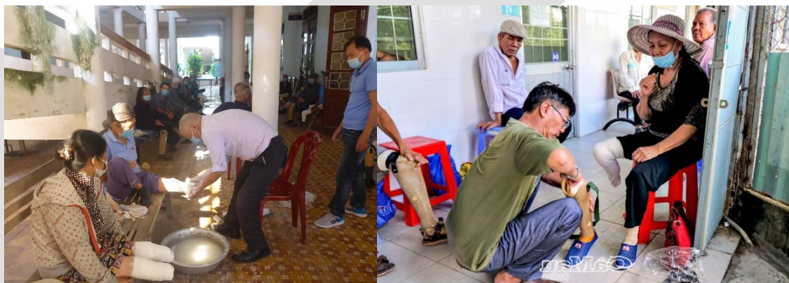
Foto's van medewerkers van de orthopedische werkplaats Ben San in de provincie Ca Mau.

E-mail info@peerkedondersstichting.nl www.peerkedondersstichting.nl